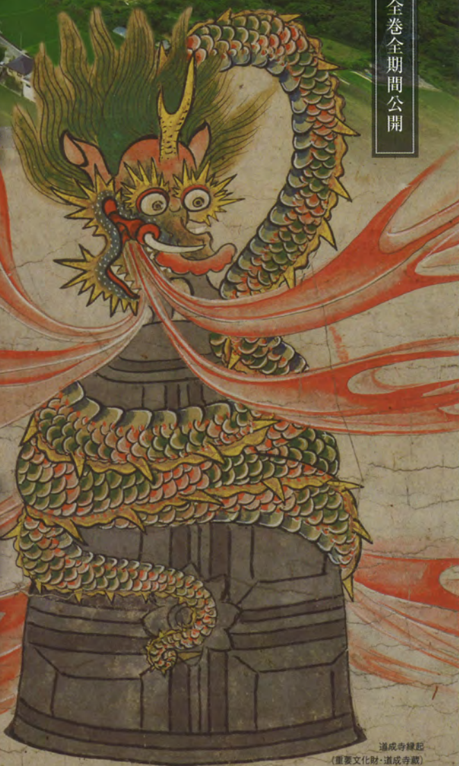
道成寺縁起 (重要文化財・道成寺蔵)