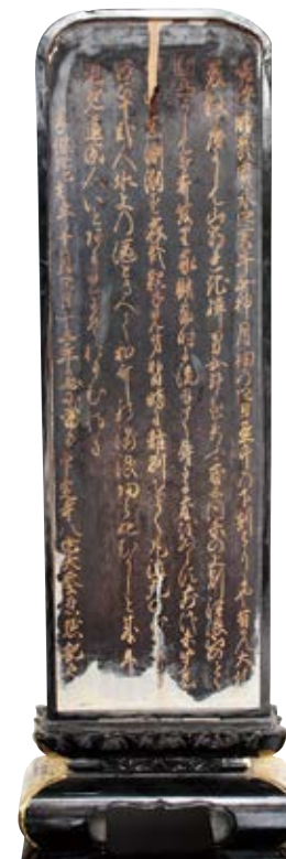
高波溺死靈名合同位牌 印定寺蔵

平成26年(2014)、印定寺山門前に解説板(伝承板)が設置されました。石碑に刻まれた記憶を、改めて見直そうとする取り組みが始まっています。