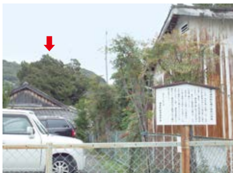
網代浦高札場跡と津波高の指標となったビヤクシン(矢印)

さてまた翌11月5日午後5時ごろ急に土けむりが吹いたかと思うと、大地震が揺れだした。まるで大地をひっくり返すかのように、家の壁や塀や屋根瓦を飛ばしながら大変長い時間揺れていた。男も女も子供も(建物の倒壊の恐れのない)広場にみんな寄り集まった。大地震の時は地割れが発生すると聞いていたので、板やたたみなどを敷いた。泣き叫んでいる者の中には氏神の八幡様へ祈ったり、念仏を唱えたりと、全員生きた心地がしなかった。そうした所へ、海の沖の方から大音響がドタンドタンとしばらくの間鳴り響いてきた。あれは雷の音だろうか、はたまた海が裂ける音かと怪しみ、ひよっとすると聞き伝えていた津波がやってくるのではとおのきなながらも、余震の間を見てはそれぞれの家財道具を移動させていた。するとその内、早くも沖の方から大津波がまるで山のように、音もなんともたえようがないほどに耳に響き、激しい勢いで水面が満ちてきたので、みんな泣き叫びながら、持っていた荷物を投げ捨て、命の限り逃げ走った。足の速い者は里村まで逃げてゆき、遅い者は宇佐八幡神社の高みや東側の高み、宮山や北山などへ逃げ、ようやく命だけは助かり、危難から逃れた。中でも横浜村だけでも死亡した男女が17人もいた。家屋は約100軒あったうち80軒あまりが流され、17軒だけ残った。この日の夜に余震がまた1回あり、その後も夜明けまで14～15回揺れた。津波は深夜0時まで7回やってきたが、夕方のものが一番大きなもので、それから段々小さくなっていったように見えた。