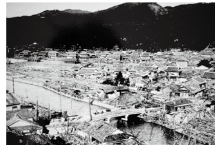
地震直後の網代・横浜・南地区 由良町教育委員会蔵

昭和南海地震から70年が過ぎた今日、地震・津波の経験者は少なくなっています。被災者から話を聞くなど、この地震・津波の経験を掘り起こし、伝えていく必要があるのではないのでしょうか。