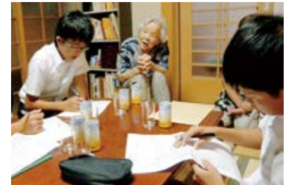
昭和南海地震の体験者への聞き取り (2016年8月)