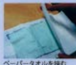
ペーパータオルを挟む

③ 開いたページにペーパータオルを挿入し、一度冊子を閉じる。表紙の上にペーパータオルをもう一枚置き、その上から軽く押さえてペーパータオルに水分を吸収させる。