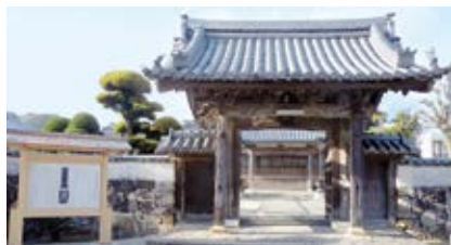
印定寺山門と解説板

印南町印南の印定寺(浄土宗)には、宝永4年(1707)の宝永地震津波で亡くなった人々を供養するとともに、津波の記憶を後世に伝えるために、13回忌に当たる享保4年(1719)に建てられた「高波溺死靈魂之墓」碑(写真左)と高波溺死靈名合同位牌(写真右)が残されています。とくに、「高波溺死靈魂之墓」碑の背面には、村人みんなが知っている場所(札之辻、印定寺、山口村境)を基準に、宝永の地震津波の到達点を示している点が注目されます。