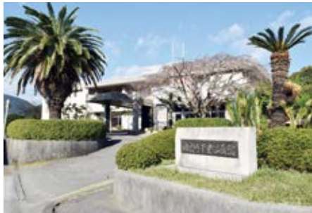
由良町中央公民館、手前に見えるのが標石