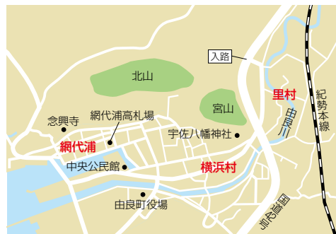
由良川河口周辺図

安政南海地震津波の被害を受けた地域では、地震や津波の発生前後の状況(気象や社会状況)や被害状況、そして教訓などを綴った記録が体験者によって作成されました。それらは、作成された各地における地震津波経験を現代に伝える貴重な情報源です。由良町でも、こうした記録が何点か伝わっています。なかでも著名なのが、今回紹介する「津浪之由来(記録)下書」です。すでに、『由良町誌』史(資料編(870～879ページ)などでも原文が掲載されていますので、ぜひともじっくりお読みください。ここでは、11月5日の南海地震津波発生時の部分を現代語訳にしました。