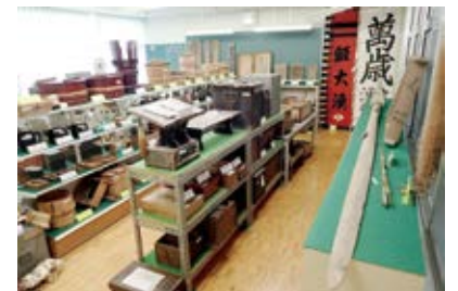
町内に残る民具・漁具などが整理・保管されている 第3展示室(民具・漁具室)

* 展示内容などの詳細は、大野治「由良町文化財整理作業 —ふるさと資料展示— を終えて」(「由良町の文化財」第39号、2012年に収録)に掲載されています。