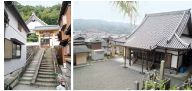
昭和南海地震で網代地区の人々が避難した念興寺