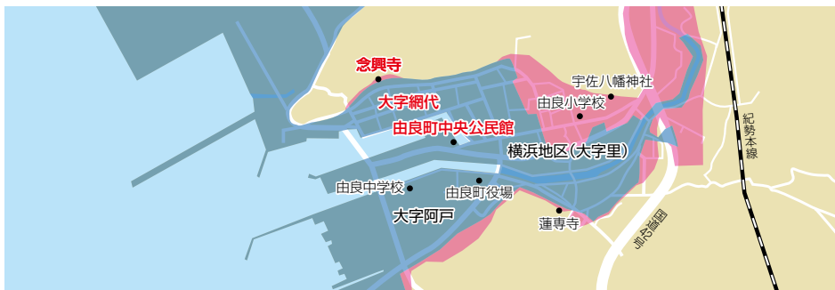
南海トラフ巨大地震津波浸水想定域と昭和南海地震津波浸水域とを重ねたもの(由良川河口周辺) ■ : 南海トラフ巨大地震津波浸水想定域 ■ : 昭和南海地震津波浸水域 (大江清氏作成地図を基に作成)