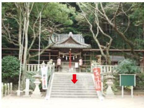
宇佐八幡神社本殿前の石段(矢印は推定津波到達点)