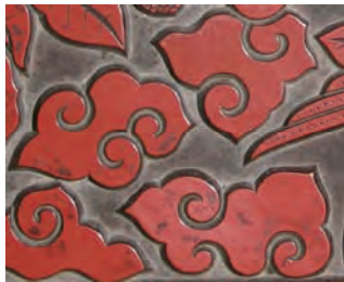
( ずいぶんもん 瑞雲 (文) )