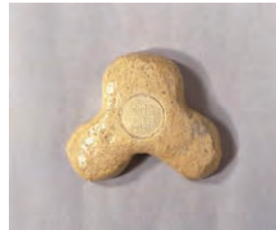
( すはまがた 州浜 (形) )