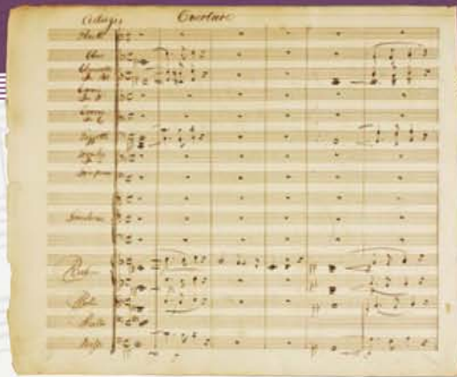
▲ウェーバー：歌劇「魔弾の射手」