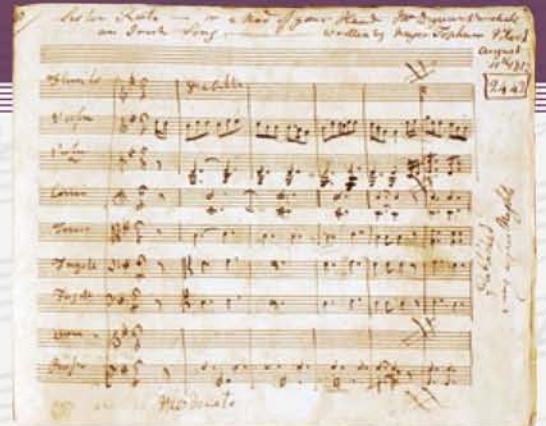
▲フック：声楽作品集