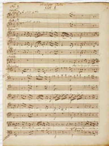
▲ザーロモン：歌劇「ウインザー城」