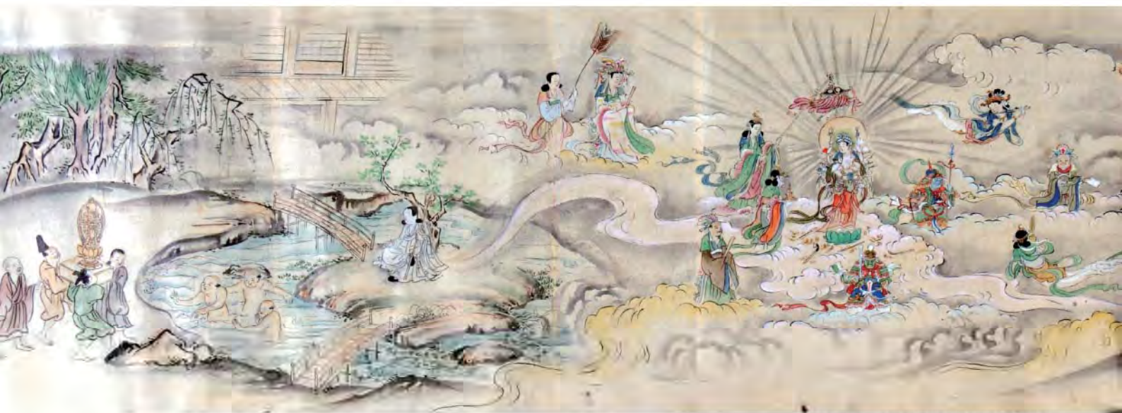
粉河寺御池海岸院本尊縁起絵巻

紀伊国一和歌山県一には、全国に名の通った多くの霊場があり、古来、多くの縁起が作られ、語られて、絵画化されてきました。この企画展では、そうした中から中世～近世にかけて作られた優れた縁起絵巻（及び縁起絵）を初公開資料を含めて一堂に展示し、宗教画としての縁起絵巻の魅力をご紹介します。