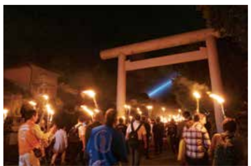
廣八幡宮への避難訓練