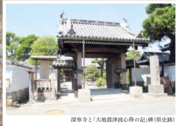
深専寺と「大地震津波心得の記」碑(県史跡)